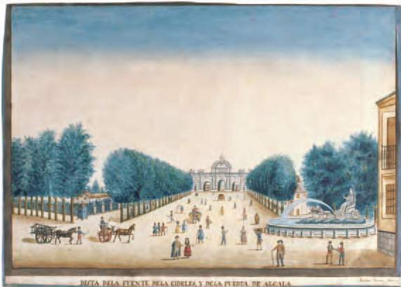
PLAZA DELA FUENTE DELA CIDELLES, Y DELA PUERTA DE ALCALA