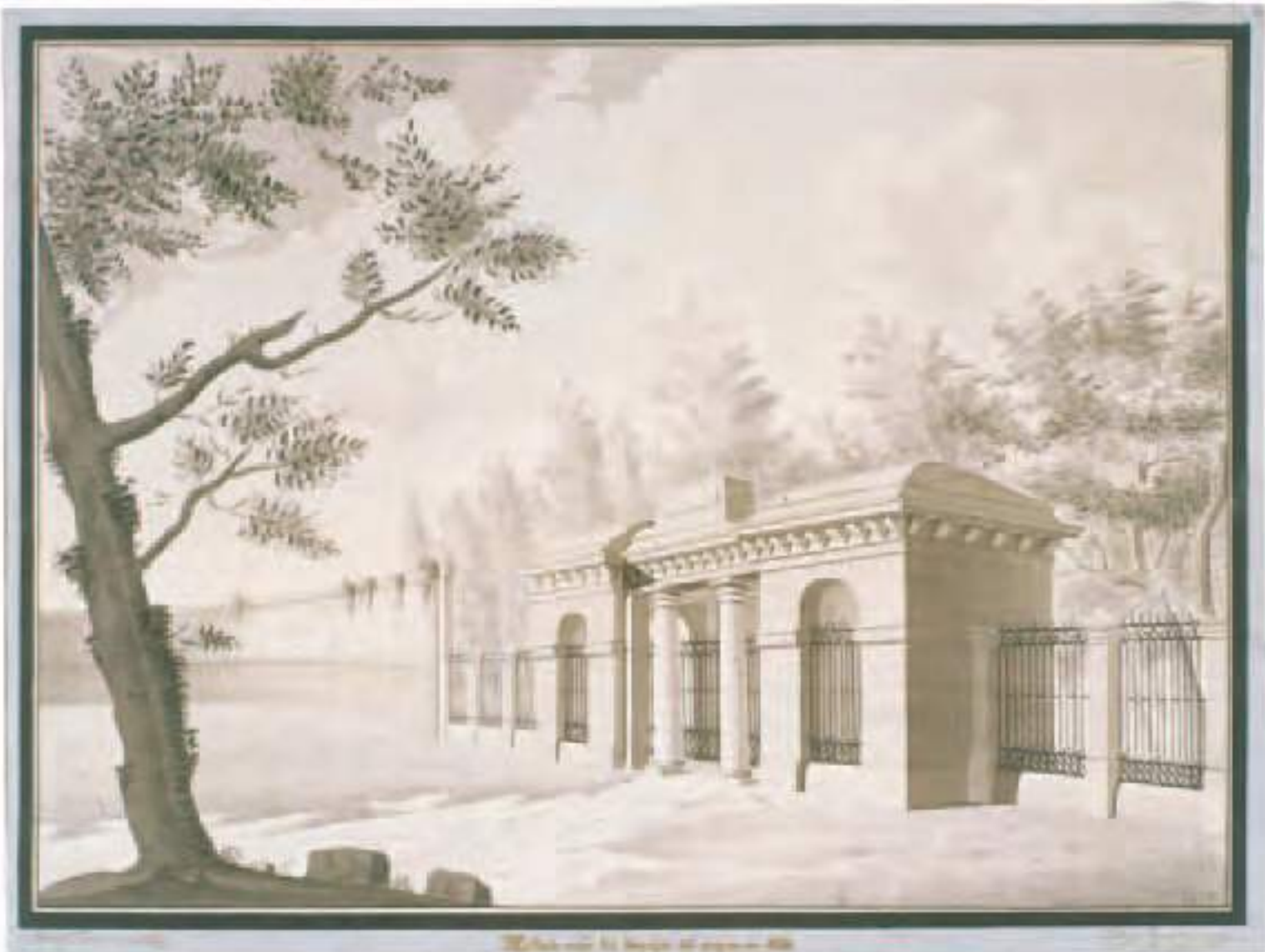
Villa di S. Margherita di Genova - 1848