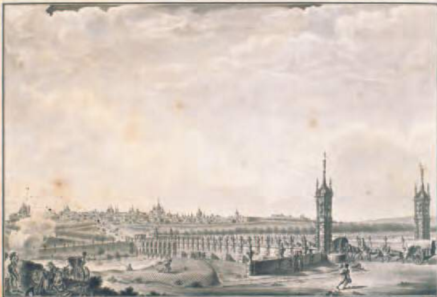
"Vista de la Villa de Madrid por la parte de Mediodía por Wilfrido Verel."