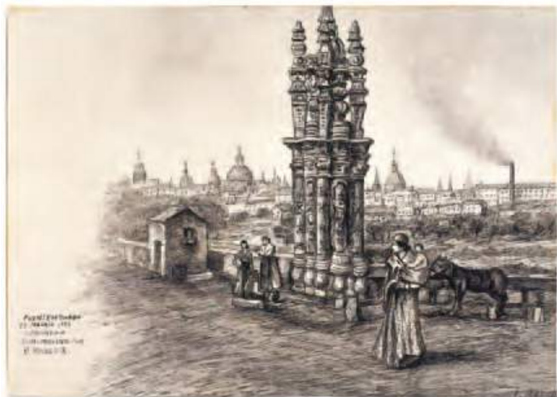
Columna de la Virgen 22. Madrid. 1851 Dibujo de D. J. G. y G. de G. y G. P. G. y G.