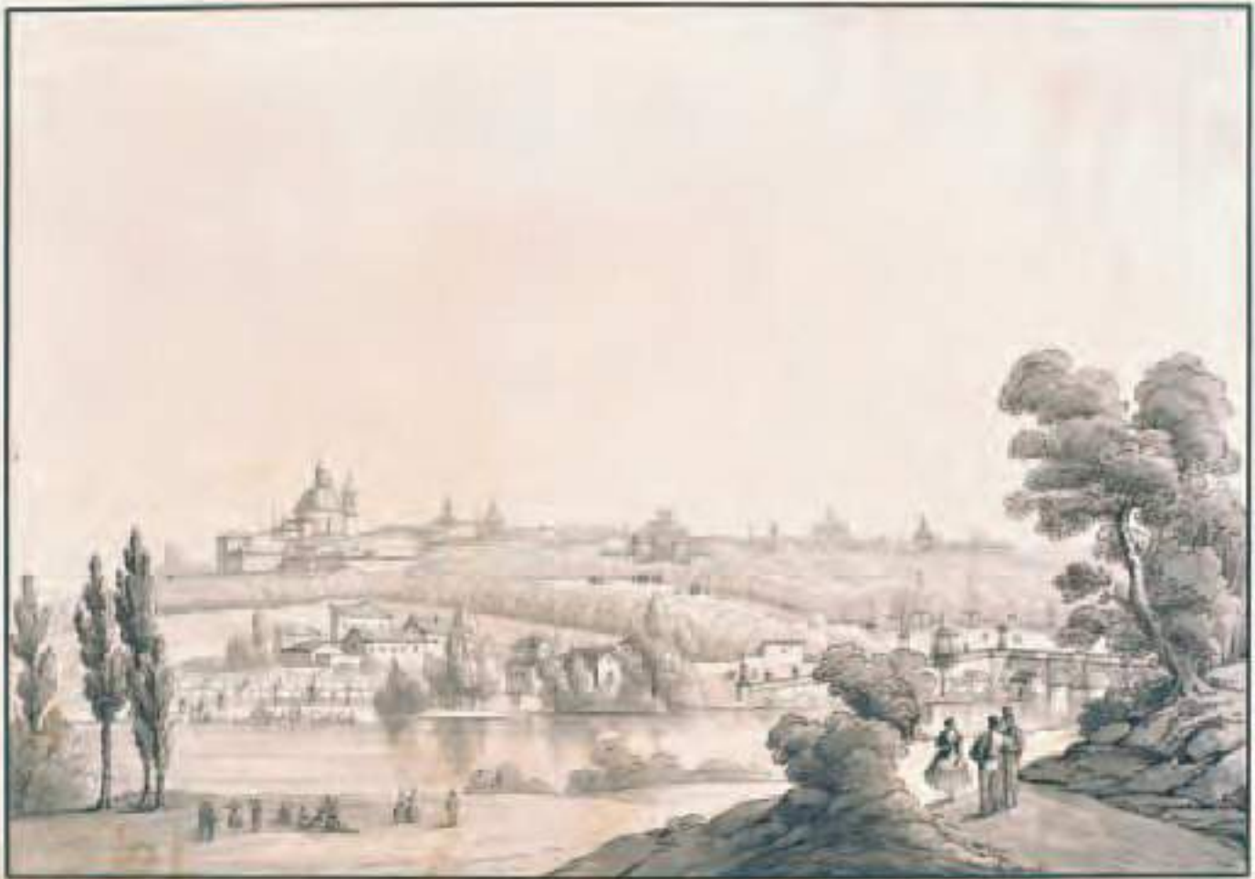
Vista de Barro, tomada desde el Cerro del Talle.