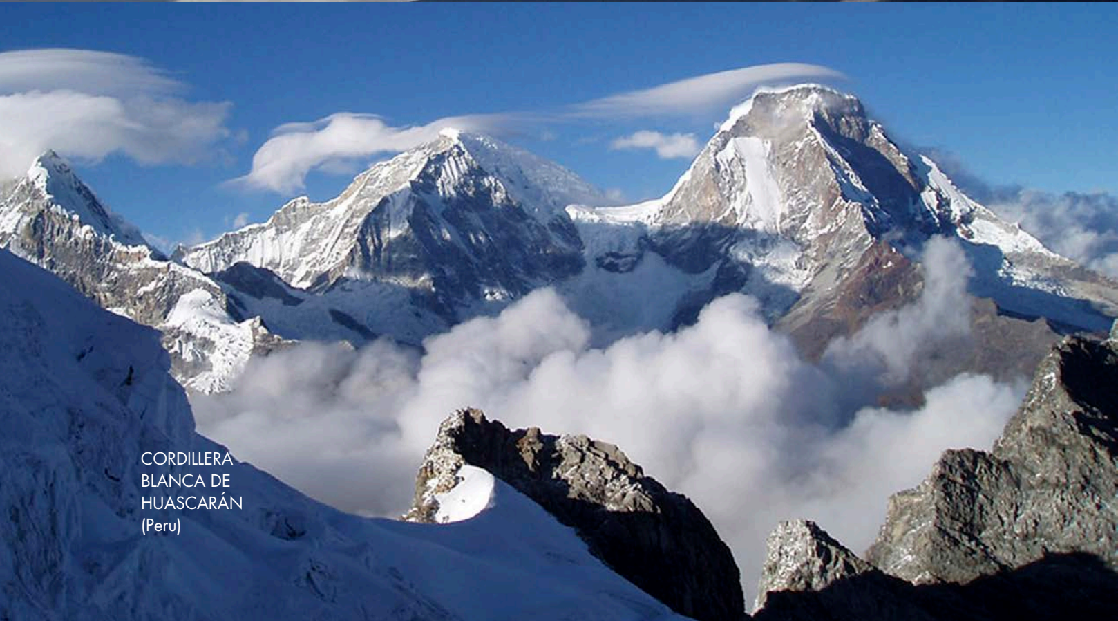
CORDILLERA BLANCA DE HUASCARÁN (Peru)