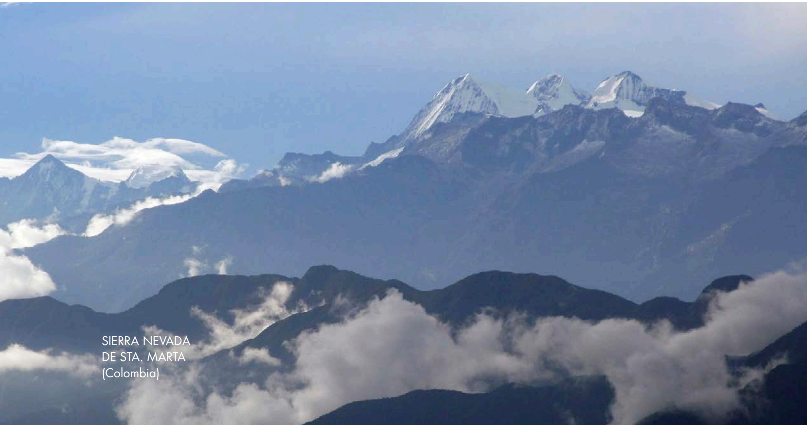
SIERRA NEVADA DE STA. MARTA (Colombia)