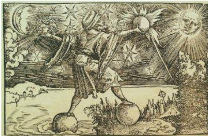
* Portada de la edición de la Historia Mundi Naturalis de Plinio el Viejo (Cayo Plinio Segundo) publicada en Fráncfort del Meno por Sigmund Feyerabend en 1582