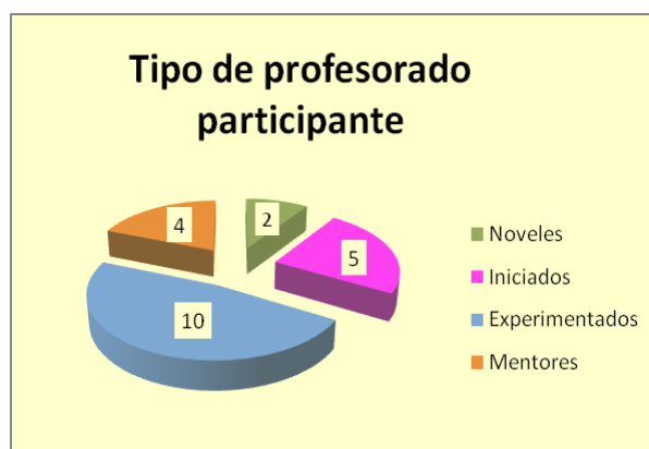
Figura 1. Tipo de profesorado que ha participado en la experiencia de mentorización

Existen cuatro situaciones desde las que optar a la participación en esta experiencia, como se muestra en la figura 1.