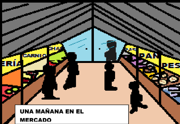
UNA MAÑANA EN EL MERCADO