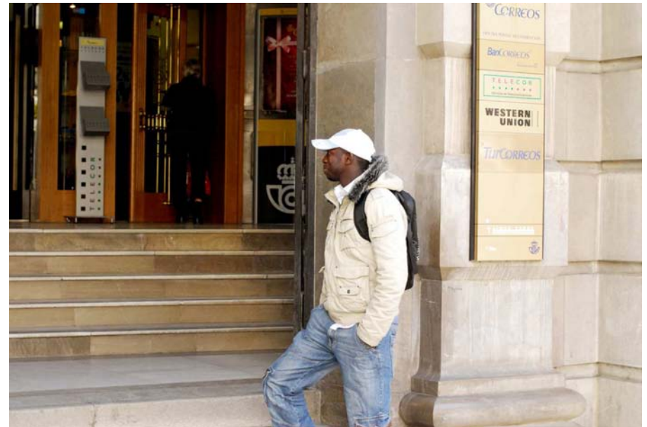
Envía el dinero a su familia.